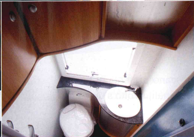
La capienza trova felice riscontro nella quantità di spazi di stivaggio organizzato come il doppio armadio, uno dei quali a ripiani, e i numerosi pensili. Ragguardevoli le dimensioni dei servizi, anche se il blocco cucina vede relegato il piano cottura in un angolo poco fruibile. In mansarda spicca la ben rifinita testiera termoformata e attrezzata.

curvo e piano lavabo in laminato grigio ad effetto marmo: un insieme ricco e confortevole, ben indovinato anche sul piano cromatico, elegante e luminoso.